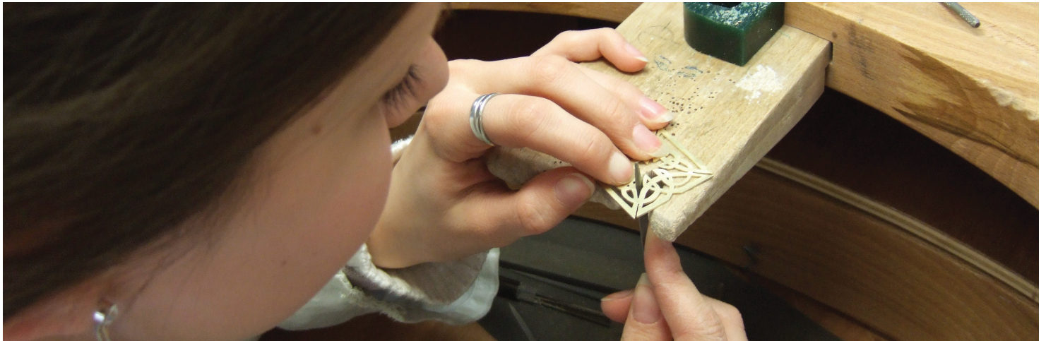
Exercice de CAP