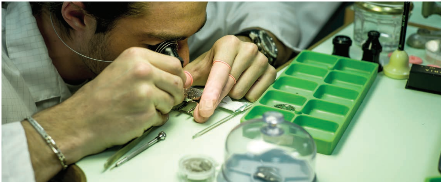
Révision sur un mouvement mécanique

• Quelques mots sur la filière S'appuyant sur la grande tradition horlogère du Haut Doubs, le lycée Edgar Faure s'impose aujourd'hui comme l'un des premiers centres de formation horlogère en France.