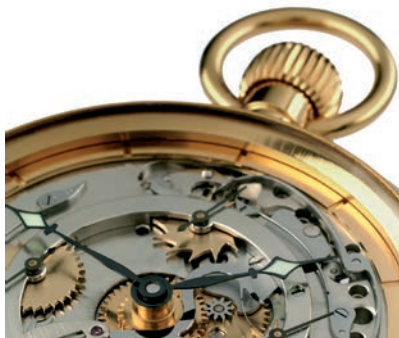
Projet du club squelette