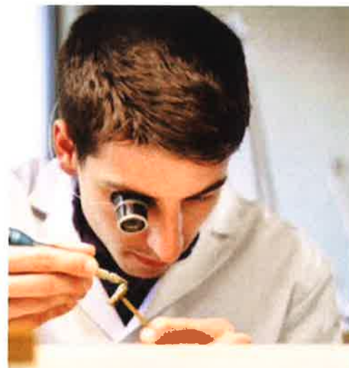
1er prix du concours Lange et Sohne 2017: réalisation d'un élève