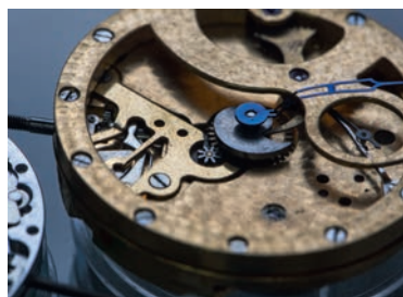
Vissage d'une couronne sur une tige de remontoir

Le titulaire du BMA (Brevet des Métiers d'Art) assure la réparation de toutes les montres et pendules. Il est capable d'usiner certaines pièces pour remplacer celles qui sont défectueuses et participe à des opérations de restauration.